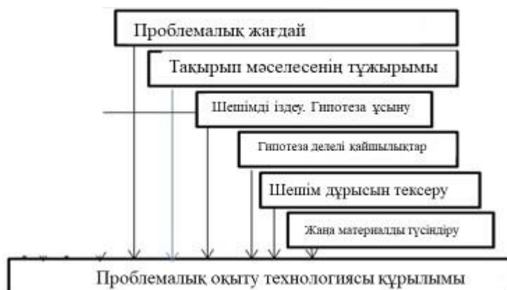
Сурет 1. «Проблемалық оқыту» технологиясы бойынша сабақтың құрылымы.

Проблемалық сабақтың құрылымынан оның орталық буыны проблемалық жағдай екенін көруге болады.(1 суретте).