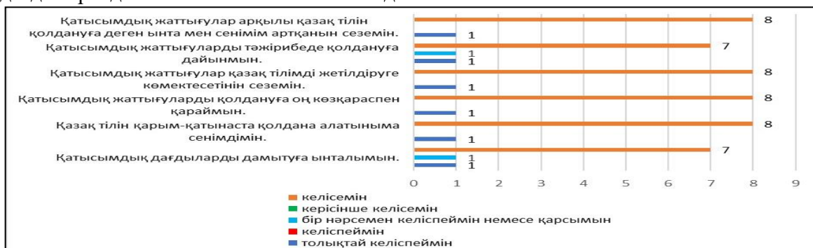
Диаграмма – 4. Білім алушылардың ынта мен сенімділікті бағалау нәтижелері

Бұдан қатысымдық жаттығулар қатысымдық дағдылардың дамуына әсер ететіні, әсіресе қазақ тілін үйретуде диалогтардың көп қолданылатыны, сонымен қатар сөйлеу мен сөйлеуді түсіну дағдылары дамытылатынына көз жеткіздік.