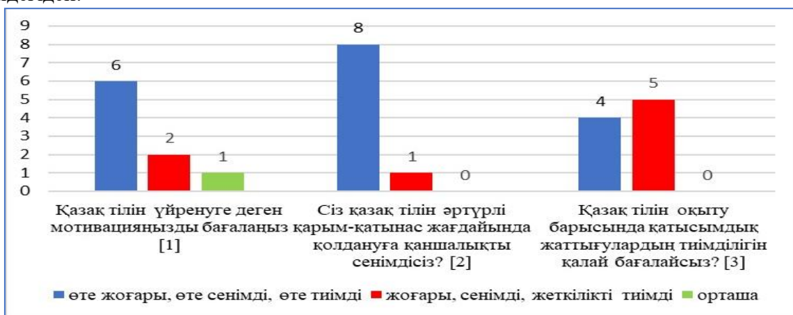
Диаграмма –1. Ынтаны, сенімділікті және қатысымдық жаттығуларды қабылдауды бағалау сауалнамасының нәтижесі

рөлдік ойындар және басқа да қатысымдық әрекеттер арқылы қарқынды тәжірибеден өткен білім алушылар тілді нақты жағдайда қолдануға дайындығы мен қабілетін көрсетті. Жалпы, бақылау қазақ тілін үйретуде қатысымдық жаттығуларды қолданудың маңыздылығын растады. Бұл білім алушылардың қазақ тілінде сөйлеу, түсіну, қарым-қатынас дағдыларын дамытуға, сонымен қатар тілді қолдануға деген сенімділігін арттыруға жетеледі. Дегенмен, оқытудың сараланған тәсілін қамтамасыз ету және әрбір білім алушының оңтайлы нәтижеге жетуіне көмектесу үшін білім алушылардың жеке қажеттіліктері мен деңгейлеріне назар аудару қажет екендігі байқалды. Бұл оқыту әдістемесін жетілдіріп, білім алушылардың қазақ тілінде қатысымдық дағдыларын дамытуда жақсы нәтижелерге қол жеткізуге болатындығын көрсетті. Тест арқылы білім алушылардың қатысымдық жаттығулар әдістемесін қолданар алдындағы және одан кейінгі қатысымдық дағдыларының даму деңгейі бағаланды. Бұл тәжірибелік тест қазақ тілінде тыңдап түсіну, оқу, сөйлеу және жазу сияқты қатысымдық дағдыларының әртүрлі аспектілерінің даму деңгейін бағалауға мүмкіндік берді. Тест нәтижелері білім алушылардың тілді қолданудағы күшті және әлсіз жақтарын анықтауға және олардың әрі қарай оқуға деген қажеттіліктерін анықтауға көмектесті. Нәтижелерді талдау әдісі арқылы жиналған деректер бойынша статистикалық талдау жасалды. Талдау нәтижелері төмендегідей: